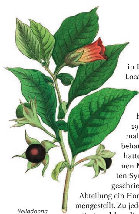
Belladonna wird bei schnellem Anstieg des Fiebers eingesetzt

in Indien. Hier in Locarno habe ich ähnliche Erfahrungen gemacht. Um in unserem Krankenhaus vor Ort COVID-19-Erkrankungen optimal homöopathisch behandeln zu können, hatte ich in einem kleinen Manual die wichtigsten Symptome zusammengeschrieben und für jede