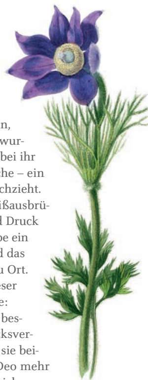
Pulsatilla hilft bei Verlust des Geruchs- und Geschmackssinns

Eine Patientin, 35, aus dem Tessin, war in der Altenpflege tätig und wurde COVID-positiv getestet. Auch bei ihr zeigte sich diese extreme Schwäche – ein Symptom, das sich wirklich durchzieht. Zusätzlich klagte sie über Schweißausbrüche, Kopfdruck, Augendruck und Druck auf der Lunge. Sie sagte: „Ich habe ein Schwitzen unter den Achseln und das Gefühl, das Virus geht von Ort zu Ort. Und in der Brustmitte immer dieser Druck.“ Auch bei ihr die Therapie: Bryonia . Es ging ihr sehr schnell besser, aber Geruchs- und Geschmacksverlust blieben bestehen. So konnte sie beispielsweise kein Duschgel oder Deo mehr riechen. Im Repertorium findet sich bei Geruchsverlust, Geschmacksverlust von Speisen und Geschmacksverminderung ein wunderbares Mittel: Pulsatilla . Ich gab ihr das Mittel, und innerhalb von 1 Woche waren ihr Geschmacks- und Geruchssinn völlig wiederhergestellt.